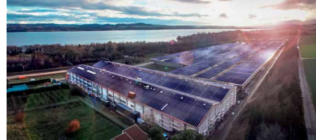
Instalación fotovoltaica más grande de Suiza realizada por Soleol en Onnens: 31,000 paneles, 55,000 m 2 , 8.5MW. Abastece la electricidad a 2,500 casas.