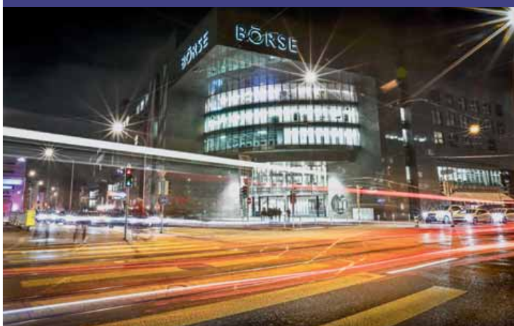
Bolsa de valores de Zúrich.