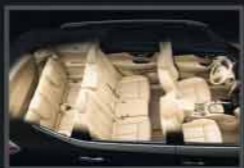
Gran espacio interior con tercera fila.