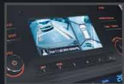
Around View Monitor (Visión 360°).