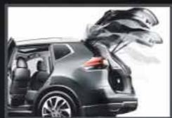
Apertura de maletera automática "Sin Tacto".