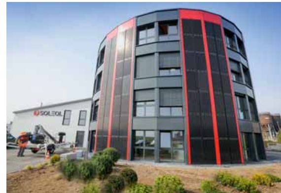
El nuevo edificio de la empresa Soleol en Suiza, con las últimas tecnologías, único en Europa. El costo de la construcción fue de 6 millones de dólares.

Recibió dicha distinción también por haber creado el Swiss Peruvian Cluster que es un grupo económico que integran firmas suizas que ejercen actualmente una actividad comercial en el Perú, tales como, Nestlé, ABB, SOLEOL, NOVARTIS, Credit Suisse, POYRY, Lat-Am Capital, Camara de comercio suiza en Peru, Latin Business Network y el Hotel St. Gotthard de Zúrich, destinado a la promoción comercial y enlace de empresas privadas suizas instaladas en el Perú o Pymes suizas que deseen instalarse en el Perú.